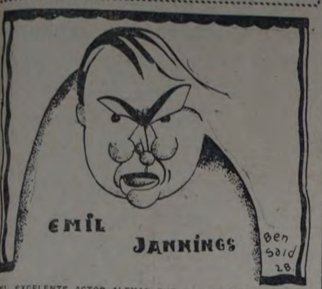
EL EXCELENTE ACTOR ALEMÁN QUE HA OBTENIDO UN NUEVO TRIUNFO CON SU PELÍCULA "LA ÚLTIMA ORDEN".