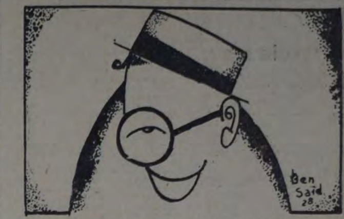
EL POPULAR COMICO DE LA PANTALLA. CUYA PELÍCULA "UNA COSA ES PREDICAR" SE CONTINUA EXHIBIENDO.