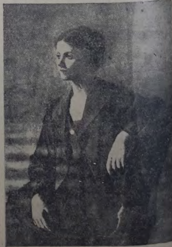
PICASSO. — RETRATO DE MADAME PICASSO.